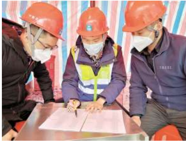
3.1.1 ( )