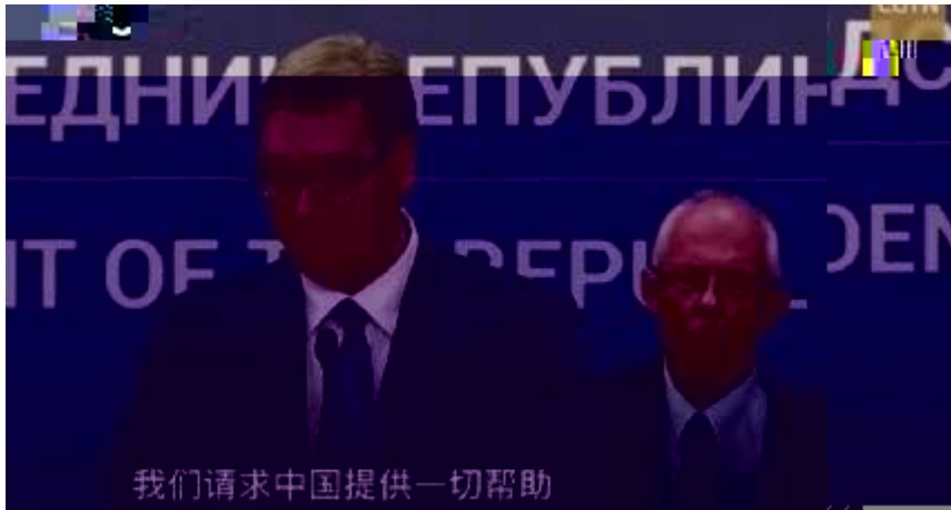
5. 1. 1 CGTN